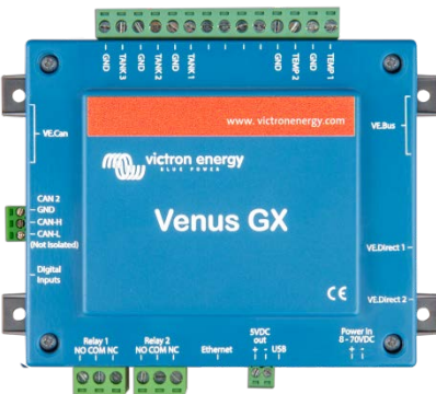
Venus GX mit Steckern