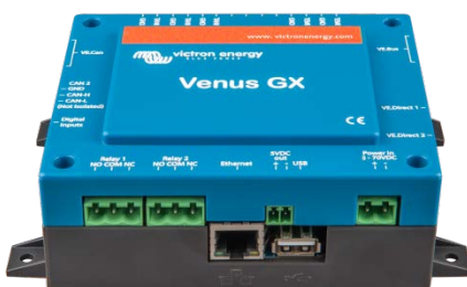
Venus GX Vorderansicht